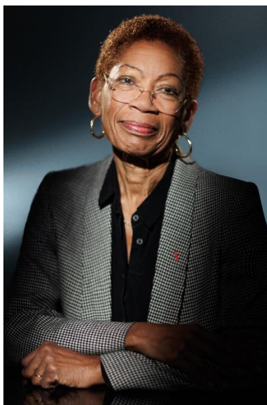
GEORGE PAU-LANGEVIN ANDREA.

Diskriminazioen aurkako borroka eta berdintasunaren sustapenez arduratzen den albokoa (Frantziako Eskubideen Defentsa-erakundea). Adjunta encargada de la lucha contra las discriminaciones y de la promoción de la igualdad (Defensoría de los Derechos de Francia).