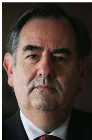
ÁLVARO GIL ROBLES.

Espainako herriaren defendatzaile ohia eta Europako Kontseiluko Giza Eskubideen komisario ohia. / Exdefensor del Pueblo de España y excomisario de Derechos Humanos del Consejo de Europa.