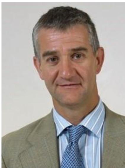
ANDONI ITURBE MACH.

Eusko Legebiltzarreko legelari nagusia. / Letrado mayor del Parlamento Vasco