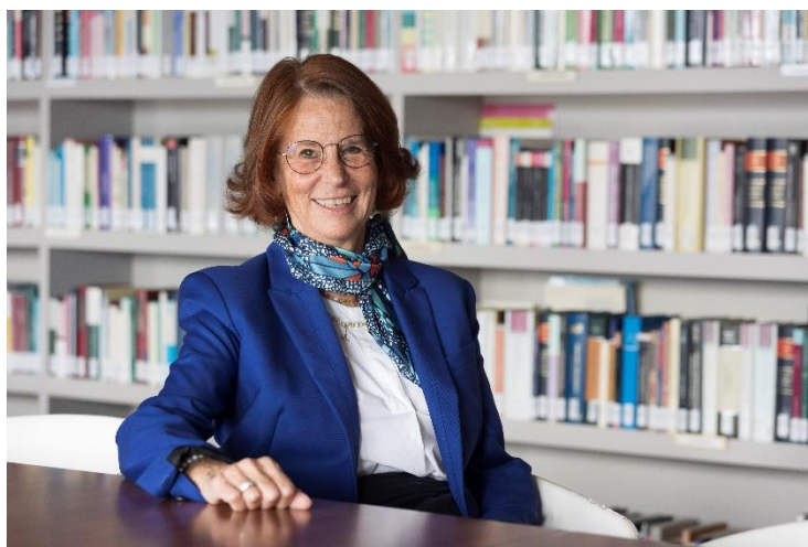
ESTHER GIMÉNEZ-SALINAS Y COLOMER.

Kataluniako síndic de greuges. / Síndica de greuges de Catalunya.