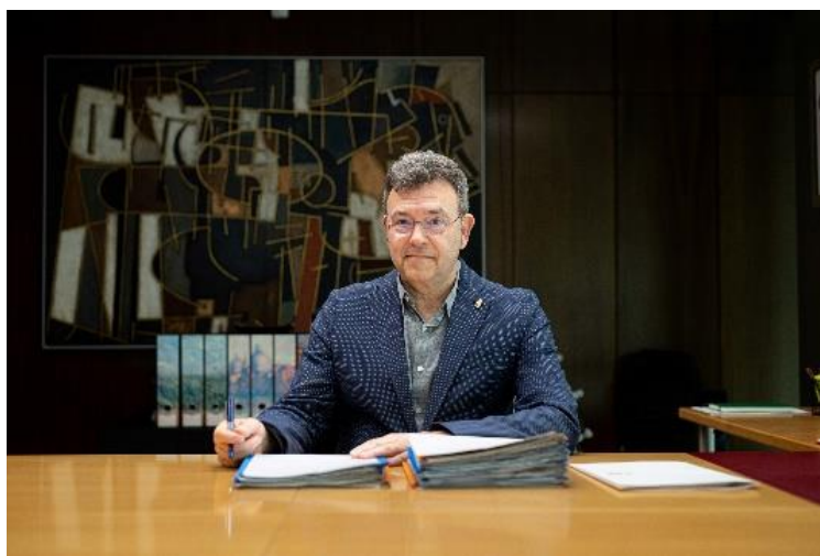
PATXI VERA DONAZAR.

Nafarroako arartekoa. / Defensor del pueblo de Navarra.